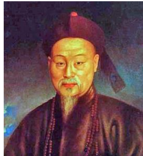
LIN ZEXU IN HET TENUE VAN HOGE MANCHU AMBTENAAR

Hij kreeg nooit antwoord, maar het was duidelijk dat met de opiumsmokkel astronomische bedragen aan drugsgeld werden verdiend. Engeland stuurde een grote oorlogsvloot naar China om compensatie te eisen voor het verlies van haar verbrande opium. Deze Eerste Opiumoorlog (1839-41) was in feite een strijd